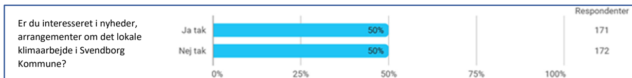
Figur 3: En del borgere ønsker at modtage nyheder om klimaarbejdet i kommunen

Det var forrest i spørgeskemaet angivet, at kategorien "biler" kun handlede om produktion af biler. Kategorien blev medtaget efter en dialog med CONCITO, men administrationen formoder, at personer har svaret ud fra en betragtning om, at det handlede om biltransport. Formodningen skyldes svarerne på det åbne spørgsmål om, hvorvidt de havde idéer til, hvad kommunen kan gøre inden for et eller flere af indsatsområderne? Her er der rigtig mange, som har givet forslag til indsatser vedrørende ladestandere, bilfrit centrum, bedre offentlig trafik og flere cykelstier.